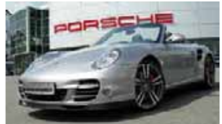
6 Porsche 911 Turbo Cabriolet GT-silber metallic EZ 10/2009 | 12.200 km | EUR 134.800*