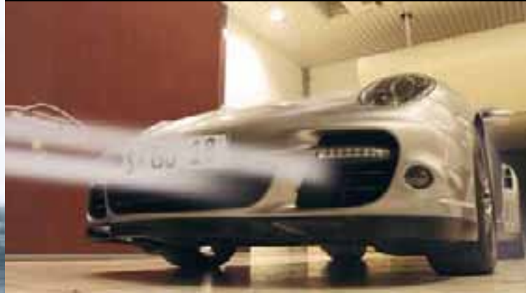
Im Lichttunnel wird die Lackierung geprüft.