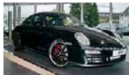
6 Porsche 911 Carrera GTS Schwarz EZ 12/2010 | 17.400 km | EUR 101.700*