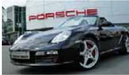
2 Porsche Boxster S Basaltschwarzmetallic EZ 03/2009 | 38.400 km | EUR 46.200*