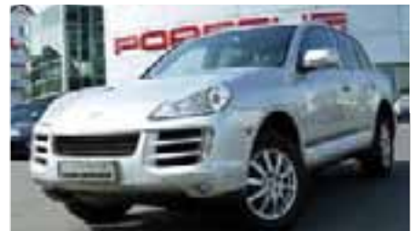
9 Porsche Cayenne Diesel Tiptronic Kristallsilber metallic EZ 04/2009 | 42.800 km | EUR 55.400*