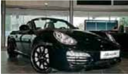
1 Porsche Boxster Schwarz EZ 04/2011 | 10.000 km | EUR 51.800*

Weitere attraktive Angebote finden Sie unter www.porsche-hofheim.de .