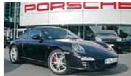
3 Porsche 911 Carrera S Basaltschwarzmetalllic EZ 07/2010 | 31.600 km | EUR 87.900*