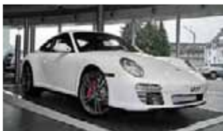
5 Porsche 911 Carrera 4S Carraraweiß EZ 04/2011 | 10.000 km | EUR 109.400*