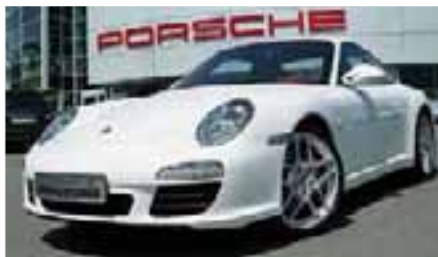
2 Porsche 911 Carrera S Carraraweiß EZ 07/2009 | 34.500 km | EUR 79.800*