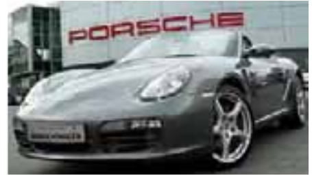
3 Porsche Boxster S Meteorgrau metallic EZ 03/2009 | 17.700 km | EUR 46.800*