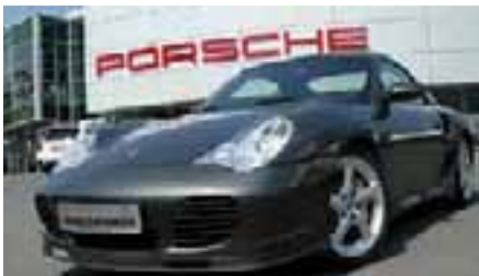
7 Porsche 911 Turbo S Cabriolet Schiefer metallic EZ 12/2004 | 74.200 km | EUR 67.900*