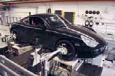
Messtechnik zur Fahrwerk-Erprobung.