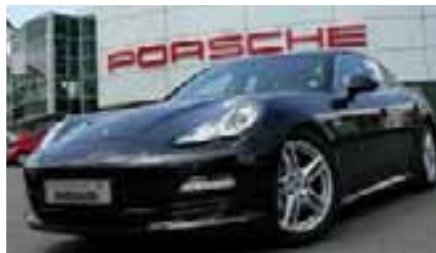
8 Porsche Panamera S Basaltschwarzmetallic EZ 07/2010 | 29.400 km | EUR 91.400*