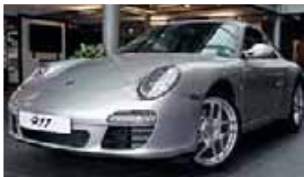
1 Porsche 911 Carrera Arktissilbermetalllic EZ 06/2010 | 31.400 km | EUR 71.800*

Ein Angebot der Porsche Financial Services GmbH & Co. KG, gültig bei Vertragsabschluss und Fahrzeugübernahme bis 30. September 2011 in teilnehmenden Porsche Zentren. Preisangaben inkl. Mehrwertsteuer zzgl. Überführungskosten.