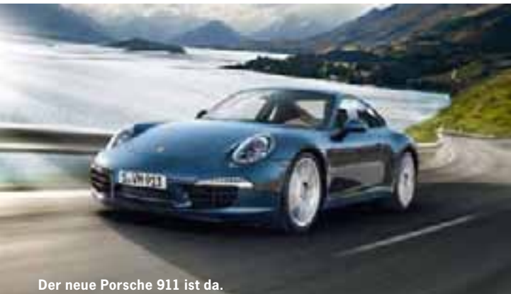
Der neue Porsche 911 ist da.