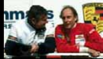
Darnals wie heute ist der geniale Konstrukteur ein wichtiger Berater im Rennsport.