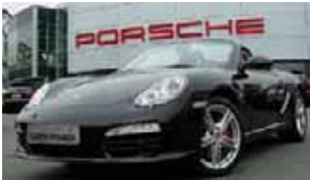
4 Porsche Boxster S Schwarz EZ 03/2009 | 18.600 km | EUR 49.800*