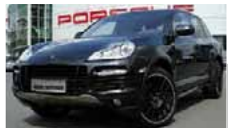
12 Porsche Cayenne GTS Tiptronic Basaltschwarzmetallic EZ 01/2010 | 37.400 km | EUR 68.400*