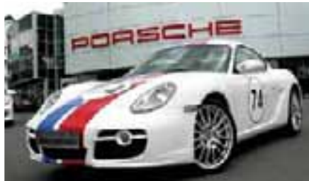
5 Porsche Cayman S Carraraweiß EZ 04/2008 | 25.500 km | EUR 44.600*