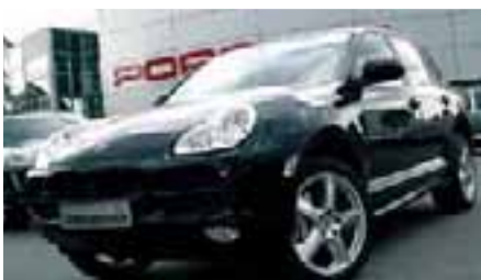
10 Porsche Cayenne S Tiptronic Basaltschwarzmetallic EZ 10/2005 | 95.800 km | EUR 30.800