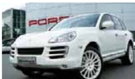
11 Porsche Cayenne S Tiptronic Sandweiß EZ 06/2008 | 33.800 km | EUR 50.700*