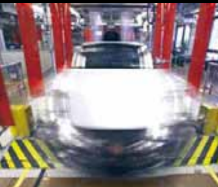
Ein Porsche Cayman S auf dem Fahrwerkprüfstand.