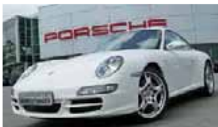
4 Porsche 911 Carrera 4S Carraraweiß EZ 01/2008 | 10.900 km | EUR 72.300*