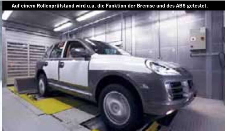
Auf einem Rollenprüfstand wird u.a. die Funktion der Bremse und des ABS getestet. Ein Porsche 911 Turbo im Windkanal.